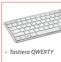
• Tastiera QWERTY