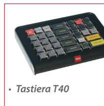
• Tastiera T40