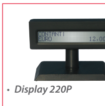
• Display 220P